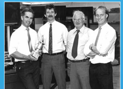
Curtis Machine Tools Ltd einst und jetzt