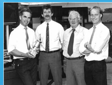
Curtis Machine Tools Ltd, autrefois et aujourd'hui